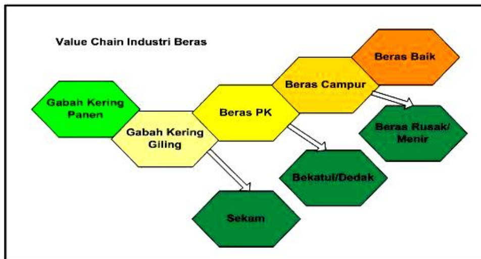
Gambar 3. Value chain industri beras

Ukuran kinerja manajemen supply chain yang dapat diterapkan dalam industri padi pasca panen :