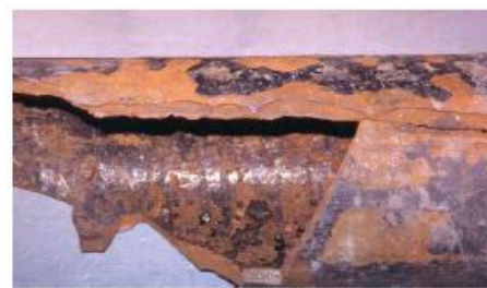
Gambar 3. Pemisahan yang panjang mengikuti garis korosi yang menyebabkan retak pada pelapisan

Korosi dapat dimulai dari perlakuan transportasi dan pembuatan instalasi. Hal ini dapat membuat pipa cacat dan memperngaruhi kekuatan dari pipa. Sebagai contohnya suatu besi cor utama ditemukan goresan yang dalam dan panjang pada pelapisan saat pemasangan instalasi. Korosi yang berkembang dari goresan ini dan ketika mencapai kedalaman tertentu menyebabkan pipa retak karena goresan korosi (lihat gambar 3).