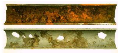
Gambar 2. Pipa air dibawah tekanan.

Graphitasi adalah isi besi yang dilepaskan melalui korosi pada suatu lokasi korosi lubang kecil meninggalkan karbon (mengkelupas). Hal ini sering terjadi pada besi cor kelabu. Graphitasi sama dengan korosi lubang kecil yaitu memperlemah struktur pipa tapi berbeda cara dalam membuat pipa bocor. Sering graphitasi tidak bocor sekalipun isi besi yang dikeluarkan semua sebab grafit yang ditinggalkan membentuk gumpalan yang dapat mencegah air dari kebocoran (lihat gambar 2). Bagaimanapun gumpalan ini dapat lepas karena pergerakan tanah, tekanan air dan lain-lain, yang menyebabkan kebocoran.