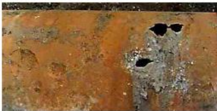
Gambar 1. Korosi eksternal pada pipa besi mampu bentuk, (sumber: Ranjani)

Korosi lubang kecil adalah korosi yang di lokalisir membuat lubang kecil pada dinding pipa, lubang kecil ini dapat membesar pada permukaan pipa sampai tembus ke dalam hingga menghasilkan kebocoran air (lihat gambar 1). Korosi lubang kecil sebagian besar menyerang pipa baja dan besi cor kelabu walaupun memungkinkan ada juga pada pipa mampu bentuk, lubang kecil ini ketika dalam dan besar dapat menyebabkan melemahnya struktur pipa, Pipa mungkin terdapat korosi lubang kecil karena tekanan eksternal yang berlebihan, memen bending, tekanan panas atau tekanan internal.