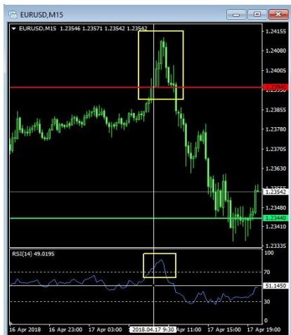
Gambar 1. Penerapan Indikator RSI 14

Pada Gambar 1. indikator RSI14 sedang berada di level oversold yang mengkonfirmasi signal sell . Penempatan open posisi ini diletakkan ketika RSI14 berada tepat diatas level 70 yaitu pada harga 1.23940 dan take profit 500 poin dibawah open posisi atau 1.23440 dan jika harga tidak berbalik arah maka dilakukan untuk membuka posisi baru ( Averaging ) pada sinyal berikutnya dengan jumlah lot lebih besar dari sebelumnya.