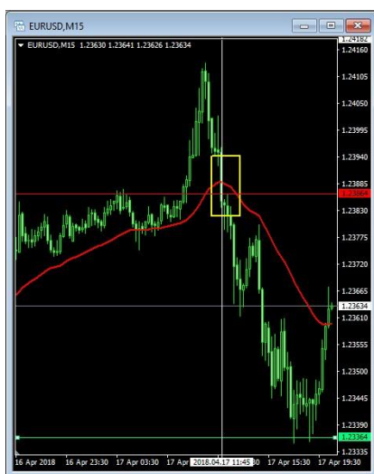
Gambar 2. Penerapan Open Posisi Indikator MA20

Gambar 2. menunjukkan pada tanggal 17 April 2018 jam 11:45 indikator MA20 sedang berada di atas harga saat itu yang mengkonfirmasi sinyal sell/jual . Penempatan transaksi/open posisi ini diletakkan ketika MA20 berada tepat di bawah harga yg sedang terjadi yaitu pada harga 1.23864 dan take profit 500 poin dibawah open posisi atau 1.23364 dan jika harga tidak mengikuti arah maka dilakukan untuk membuka posisi baru ( Averaging ) dengan berlawanan pada sinyal berikutnya, serta jumlah lot lebih besar dari sebelumnya hingga target profit terpenuhi.