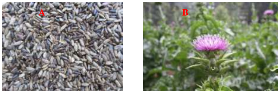
Gambar 1. Silybum marianum , biji (A), tanaman (B)

sederhana masih sering dilakukan terutama oleh masyarakat umum seperti menyeduh atau merebus tanaman obat. Penelitian ini bertujuan untuk mengetahui pengaruh cara penyiapan biji silibum dengan teknik ekstraksi sederhana yaitu cara seduh, maserasi, infusa, dan dekokta terhadap kadar sari dan kadar silymarin. Pelarut yang digunakan adalah air, mengacu pada penggunaan umum di masyarakat.