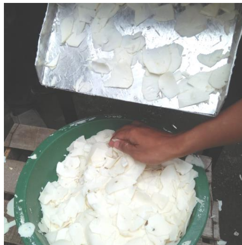
Gambar 3. Hasil perajangan dengan ketebalan seragam

Saat uji coba alat dihasilkan antara 100 sampai 120 potongan dalam waktu 1 menit. Hasil perajangan singkong seperti diperlihatkan dalam Gambar 3. Hasil ini tentu berbeda dengan perajangan menggunakan alat konvensional yang biasa digunakan, yaitu antara 60 sampai 80 irisan. Kelebihan lain dari alat ini adalah keamanan terhadap keselamatan dari teririsnya jari tangan dapat terjaga. Sedangkan perawatan mesin ini tergolong mudah, yaitu dengan membersihkan secara rutin setelah selesai digunakan. Hal ini bertujuan untuk menghindari adanya penyumbatan pada tempat pisau potong agar tetap dapat memotong dengan baik. Kebersihan terhadap alat juga harus dijaga agar produk tetap higienis, apalagi alat ini juga didukung dengan penggunaan material food grade . Proses berikutnya setelah perajangan adalah penggorengan dan pengemasan untuk dijual.