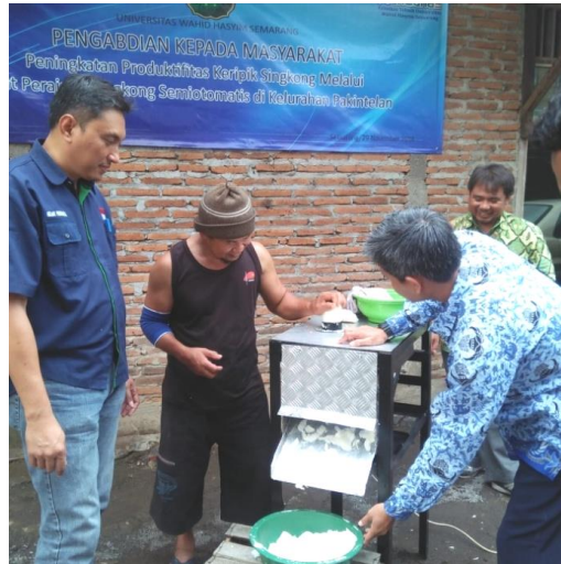
Gambar 2. Proses uji coba mesin oleh pengrajin keripik singkong

hasil potongan agar mudah ditampung ke dalam ember (lihat Gambar 3). Hasil perajangan singkong mempunyai ketebalan yang seragam antara 1 sampai 2 mm.