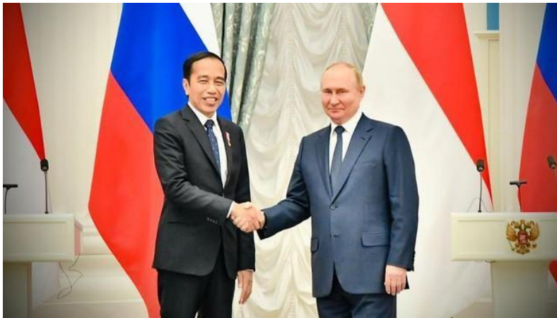
Gambar 3. Pertemuan Presiden Joko Widodo dengan Vladimir Putin (Negara, 2022)

Di dalam konferensi pers yang disampaikan oleh Bapak Jokowi, beliau menyampaikan bahwa sesuai dengan International Relations Economy, mencegah pasokan pangan terhalangi adalah suatu hal yang wajib untuk diperjuangkan karena itu adalah bagian dari isu kemanusiaan yang harus diamankan. Namun, tanggapan dari Putin adalah bahwa mereka sebenarnya tidak ada niat sama sekali untuk membatasi ekspor pangan yang memang dibutuhkan oleh negara-negara Internasional, tapi, beliau menegaskan bahwa masalahnya adalah negara barat yang malah membatasi Langkah Rusia untuk mengirimkan bahan pangan yang tentu sangat dibutuhkan guna mencegah naiknya harga bahan pangan.