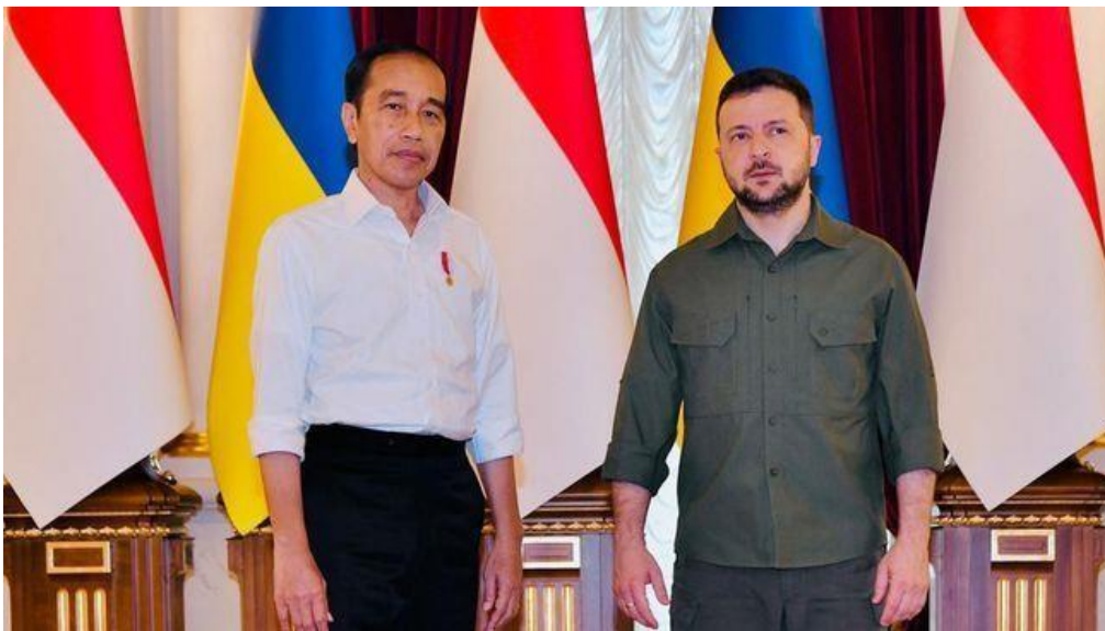
Gambar 2 Presiden Joko Widodo bertemu dengan Presiden Ukraina Volodymyr Zelenskyyy (CNBC Indonesia, 2022)

Konflik Ukraina-Rusia jelas memberikan dampak yang signifikan di dunia Internasional salah satunya yaitu kenaikan harga gandum akibat Ukraina adalah salah satu negara penghasil gandum. Serta berdampak terhadap harga minyak dunia yang membuat harga minyak non subsidi seperti pertalite, pertamax serta dex lite dan Pertamina Dex, pada tanggal 30 Juni 2024 di Kyiv, Bapak Presiden menemui Zelenskyyy untuk menjembatani dialog antara Ukraina-Rusia