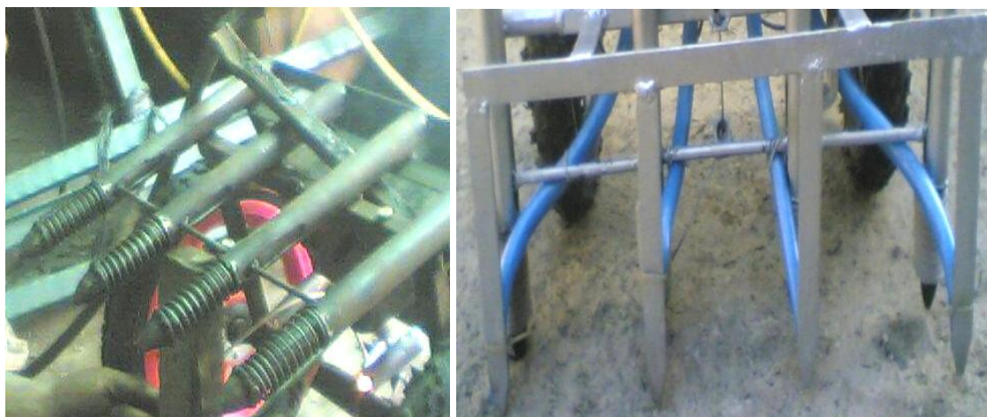
Gambar 2. Komponen Alat Tanam Benih

kemudian menutup katup kembali. Tuas pengungkit dapat menghasilkan daya dorong yang lebih maksimal untuk mengalirkan benih jagung ke dalam 4 (empat) buah pipa sekaligus. Ujung pipa secara otomatis menutup lubang dengan gesekan pada tanah; pada main machine dipasang 2 (dua) buah roda dengan tinggi seimbang dengan panjang pipa besi, dimaksudkan untuk mempermudah pergerakan. Penelitian ini memiliki perbedaan yang sangat mencolok dibandingkan dengan alat tanam benih yang ada di pasaran atau yang dikenal oleh masyarakat luas. Yaitu pada keberadaan sepasang tuas pengungkit pada pangkal pegangan yang mirip dengan pegangan rem pada sepeda. Pipa besi dengan ujung runcing untuk menambah daya dorong dalam melubangi tanah dan dikombinasikan dengan ulir untuk menambah daya bongkar pada tanah.