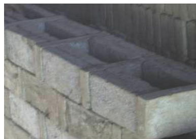
Gambar 2. Susunan dan dimensi bata di dinding tungku untuk pola 2/2.

Untuk menghitung banyaknya bata penyusun dinding tungku yang dikeringkan maka perlu mempergunakan rumus sebagai pembantu perhitungan total banyaknya bata yang kering. Pertama-tama berdasarkan pengukuran di industri dimensi bata mentah menunjukkan panjang x lebar x tebal = 25 cm x 12,5 cm dan 2,5/3 cm. Selanjutnya dengan mengacu model tungku dengan pola 1/1, 2/1, 2/2, 2/3 dan 3/2 dapat dihitung jumlah bata penyusun dinding tungku. Hal ini disesuaikan dengan kondisi dan cara pengkajian penelitian ini, dimana variabel pola diletakkan pada satu tungku dalam pembakaran bata. Untuk menghitung atau memprediksi jumlah bata kering pada tungku tak permanen maka perlu ada pola atau perumusan tertentu.