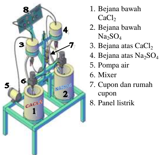
Gambar 1 Peralatan uji

Kupon dan rumah kupon terbuat dari kuningan, kupon terdiri dari empat pasang masuk kerumah kupon membentuk seperti pipa dan kupon ini dilewati larutan yang akan membentuk kerak. Adapun ukuran kupon setelah terpasang pada rumahnya: diameter dalam: 12.5 mm dan empat pasang kupon 120 mm. Kupon dan rumah kupon ditunjukkan di gambar 2.