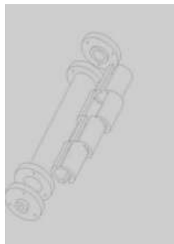
Gambar.2 Kupon dan rumahnya

Kupon dan rumah kupon terbuat dari kuningan, kupon terdiri dari empat pasang masuk kerumah kupon membentuk seperti pipa dan kupon ini dilewati larutan yang akan membentuk kerak. Adapun ukuran kupon setelah terpasang pada rumahnya: diameter dalam: 12.5 mm dan empat pasang kupon 120 mm. Kupon dan rumah kupon ditunjukkan di gambar 2.